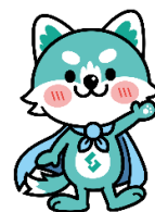
周南公立大学 マスコットキャラクター 「ウェルビー」

お問い合わせは以下のメールアドレスまでお願いします shunan.sport.med.sci@gmail.com